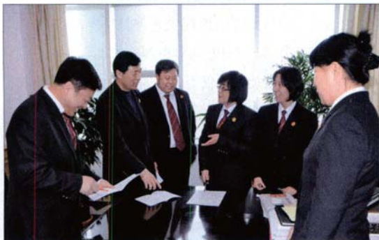
盘锦中院风险防控工作小组在研究风险防控工作