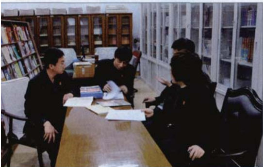
中院部门开会安排工作时也要求各人提高风险防控意识

移送的同时,也一并移交风险提示卡;在随机分案完成的同时,综合管理系统会向主审法官发出风险警示;在案件组成合议庭的同时,主管院长或庭长向合议庭成员提出风险防控的要求。这些措施的施行,较好地实现了源头监控的目的。