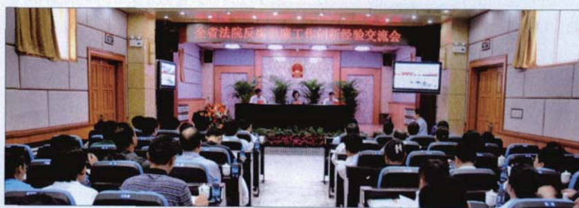
辽宁全省法院反腐倡廉现场会在盘锦中院召开